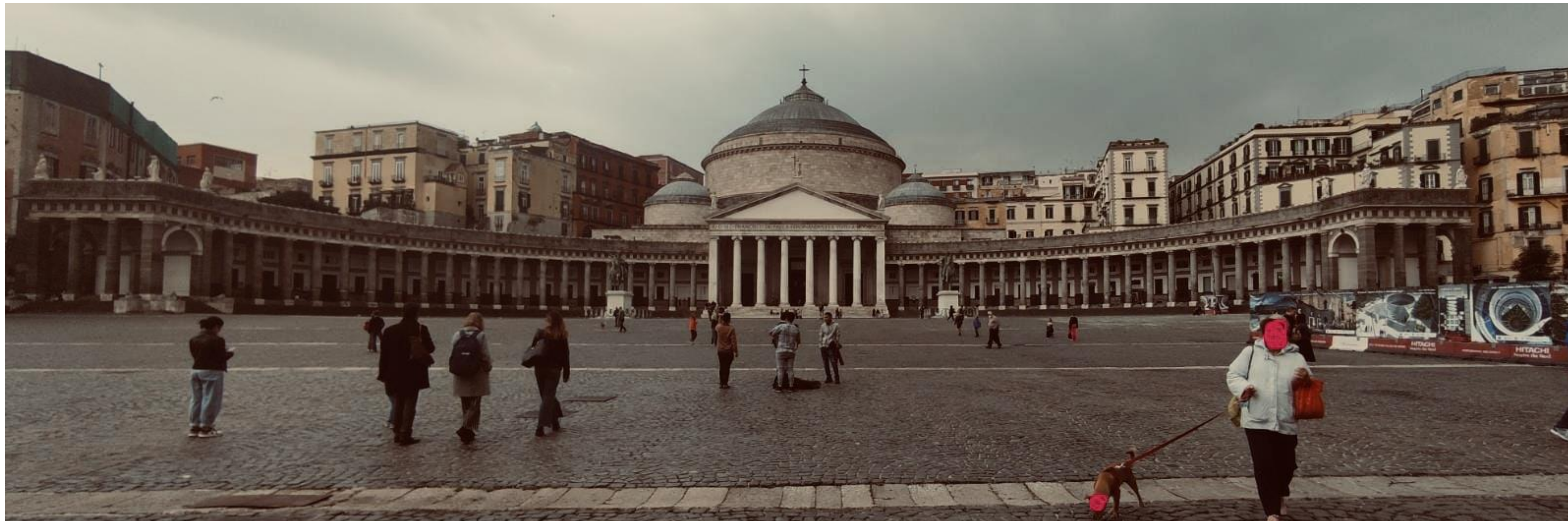
Piazza Plebiscito - Basilica di San Francesco e statue equestri